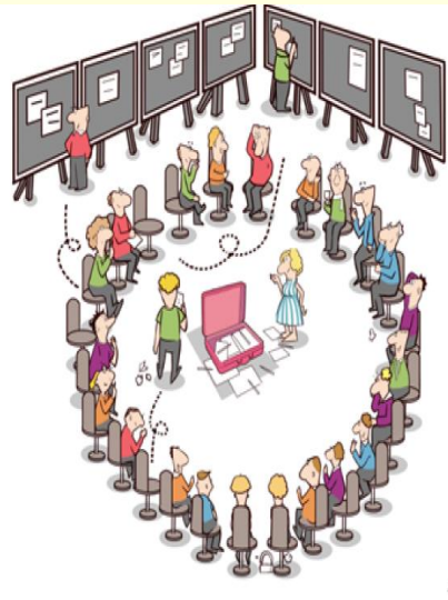
Marktplatz der Ideen

Open Space Konferenz des Regierungspräsidiums Freiburg 2016